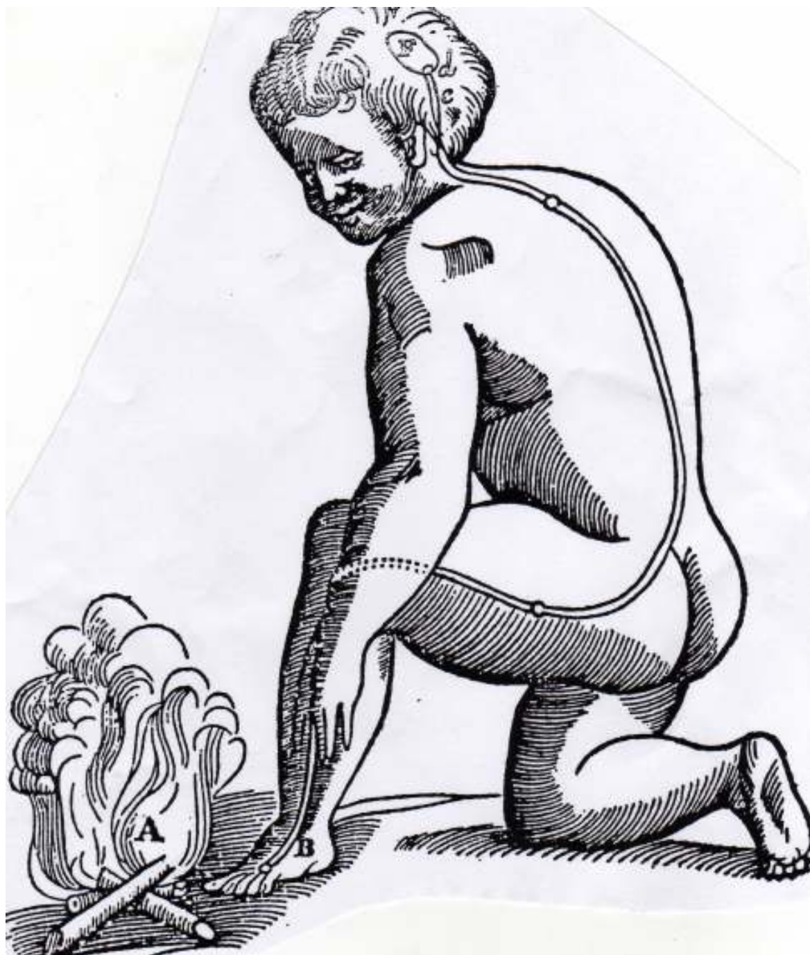
Figura 1. Menino com o pé próximo ao fogo ilustrando que o calor do fogo é sentido pela terminação nervosa, que se estende até o cérebro, onde os nervos estão ligados à glândula pineal, sede principal da alma. (DESCARTES In: MARQUES, 1993, p.204).