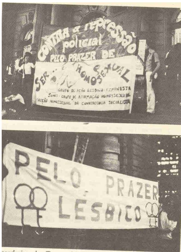
Escadarias do Teatro Municipal - faixas carregadas no protesto contra a repressão policial no centro de São Paulo.

Kinsey descobriu que é melhor pensar em termos de um continuum que se estende do comportamento exclusivamente heterossexual até o comportamento exclusivamente homossexual. A população masculina se espalha entre esses dois pólos. Assim, constatou que 37% dos homens de seu país tinham tido pelo menos uma experiência homossexual que levasse ao orgasmo. 18% tinham tido pelo menos tantas experiências homossexuais quanto heterossexuais durante um período mínimo de três anos, e 4% era exclusivamente homossexual. Mostrando a não-coincidência entre as categorias sociais de "homossexual" e "heterossexual" e o verdadeiro comportamento sexual dos homens, Kinsey acabou comprovando