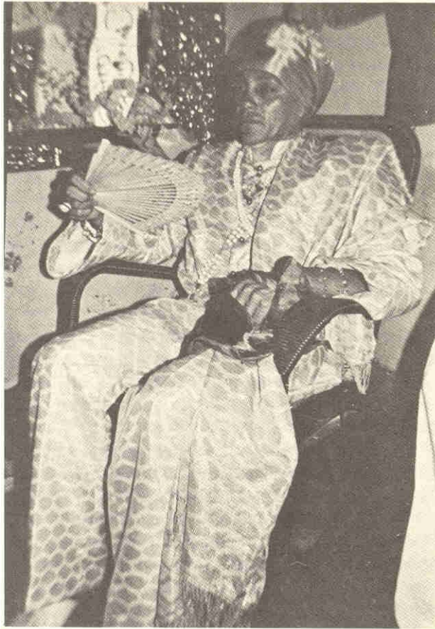
Pai-de-Santo, Belém, PA, tomado por Santa Bárbara. "Eu sou feio mas a Santa Bárbara é tão linda":