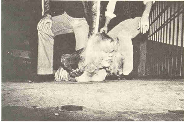
Travesti sofrendo violência nas mãos da polícia de São Paulo.